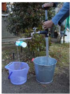
手押し加圧ポンプ(蛇口タイプ)使用例

『 手押し加圧ポンプ 』は、水の吐出側に圧力をかけることができるのが大きな特徴です。出口に水道の蛇口を付けることができるので、市販の浄水器を取り付けて使用することも可能です。普段は、散水などにも使えますので、「いざという時のためだけに用意する」という無駄がありません。