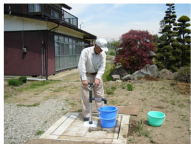
ノーマポンプ使用例(古井戸に設置)

『 ノーマポンプ 』は手動で10m以上(実験では26m)汲み上げができるので、深い井戸でも問題ありません。さらに、2m単位のパーツで構成されているので、簡単に携帯でき、狭いスペースでも保管できます。