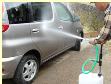
※手押し加圧ポンプ使用

ポンプ吐出側に直接ホースを付けて散水することができます。ポリタンクを携帯しておけば、直接、川や水源から水を汲み上げ、その水を利用