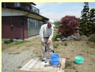
※ノーマポンプ使用

長年眠っていた井戸がノーマポンプを取り付けることによって生き返ります。井戸の深さに合わせてパイプの長さを調節できるので無駄がありません。設置