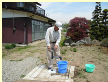
※ノーマポンプ使用

長年眠っていた井戸がノーマポンプを取り付けることによって生き返ります。井戸の深さに合わせてパイプの長さを調節できるので無駄がありません。設置